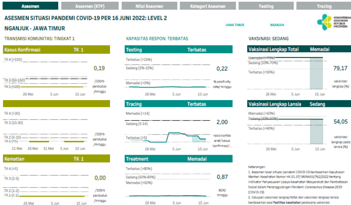
Gambar 2.1 Perkembangan Penanganan COVID-19 di Kabupaten Nganjuk Periode Juni 2022